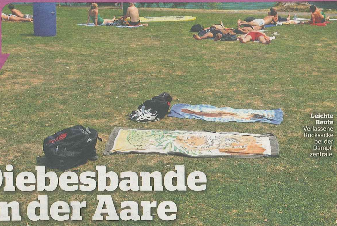
Leichte Beute Verlassene Rucksäcke bei der Dampfzentrale.