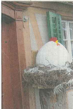
n begrüssen die Gäste. RLN

wiler «Bären». Sie können auch gekauft werden. Dabei kommt der Erlös vollumfänglich der WBM Madiswil zugut. Schon am Eingang zum «Bären» empfangen zwei Hennen die Gäste.